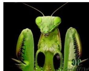
Πως χρησιμοποιώ το 1 ο μου πόδι;