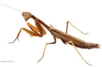
Αλογάκι της Παναγίας