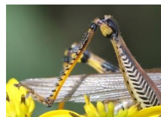
Πως χρησιμοποιώ το 3 ο μου πόδι;