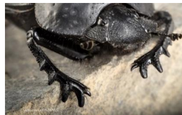
Πως χρησιμοποιώ το 1 ο μου πόδι;