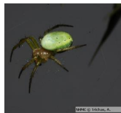
Πως χρησιμοποιώ τα πόδια μου;