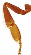
Πως χρησιμοποιώ το 3 ο μου πόδι;