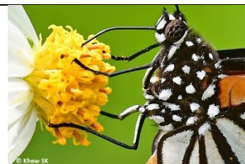
Πως χρησιμοποιώ τα πόδια μου;