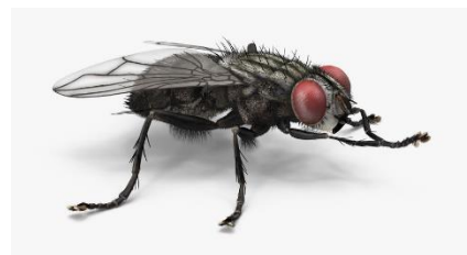
Πως χρησιμοποιώ τα πόδια μου;