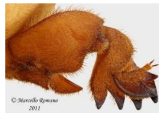
Πως χρησιμοποιώ το 1 ο μου πόδι;