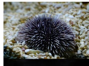
Πως χρησιμοποιώ τα πόδια μου;