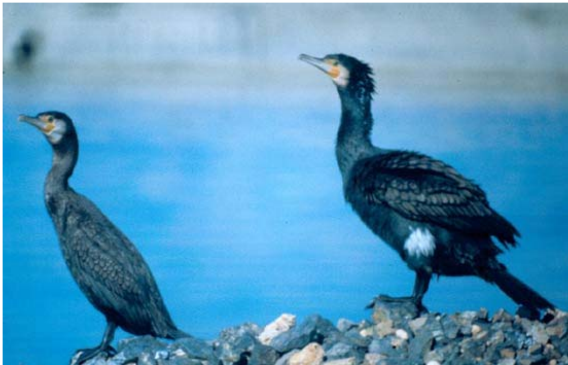
Κορμοράνοι στην ακτή