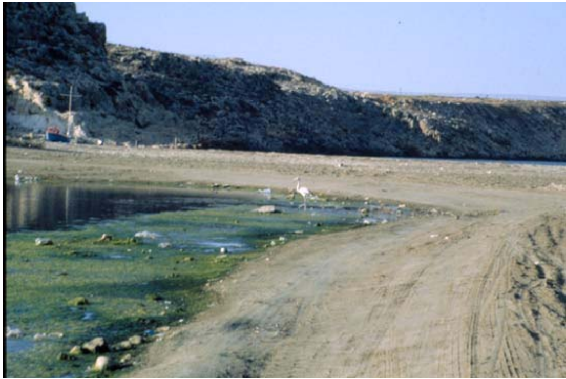
Εκβολή Καρτερού ποταμού